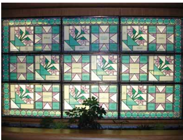
Au Moncton Hospital, en guise d'appréciation, on a monté un grand mur vitré sur lequel est inscrit le nom des donateurs.

Un bon système de reconnaissance contribue à développer un sentiment d'appartenance à la cause et resserre des liens qui incitent les bienfaiteurs à monter dans la pyramide des donateurs. Il incite également les bénévoles à s'élever dans la hiérarchie des responsabilités. Par ailleurs, la reconnaissance offerte